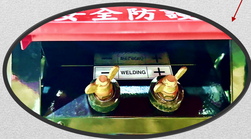
焊接輸出端正負極