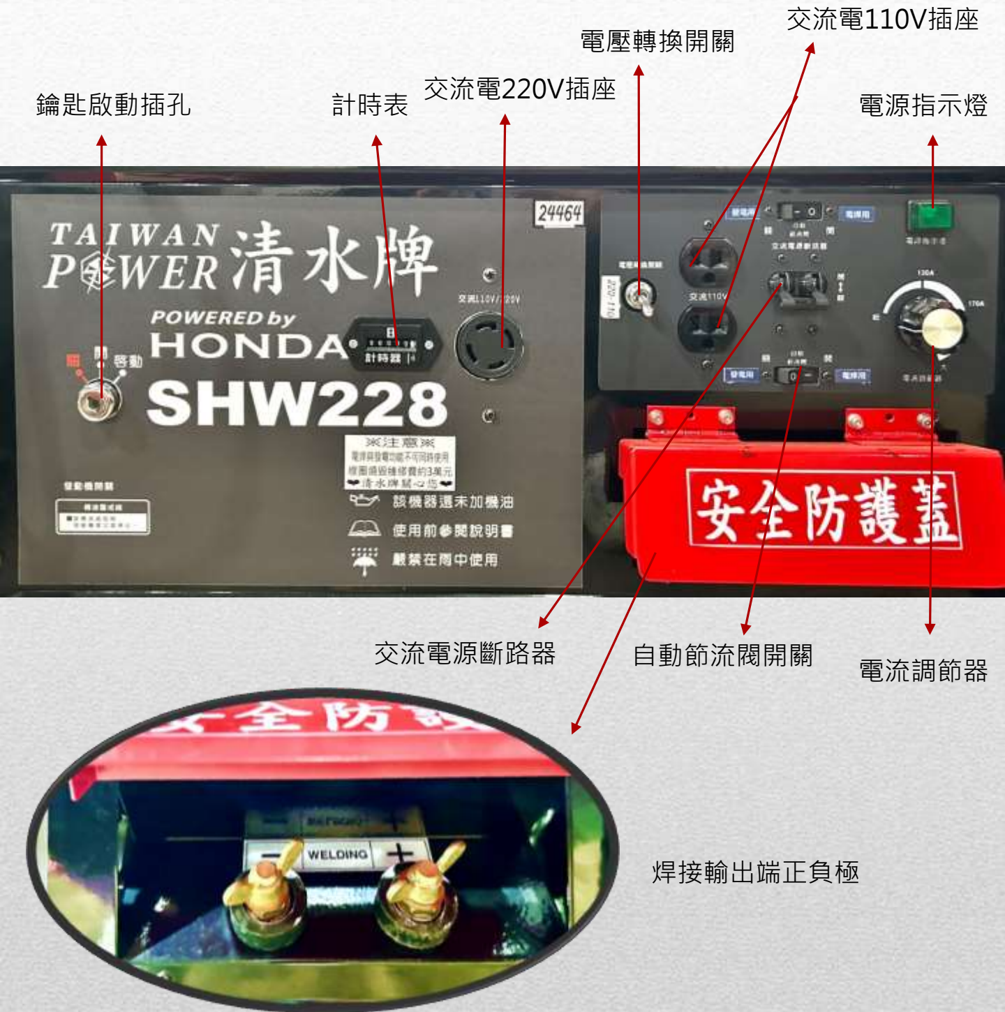
清水牌焊接發電機